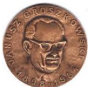
Zespół Szkół im. prof. Janusza Groszkowskiego w Mielcu