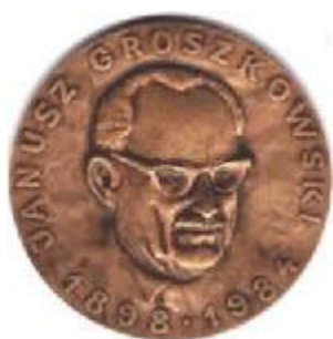
Zespół Szkół im. prof. Janusza Groszkowskiego w Mielcu