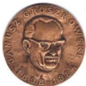
Zespół Szkół im. prof. Janusza Groszkowskiego w Mielcu